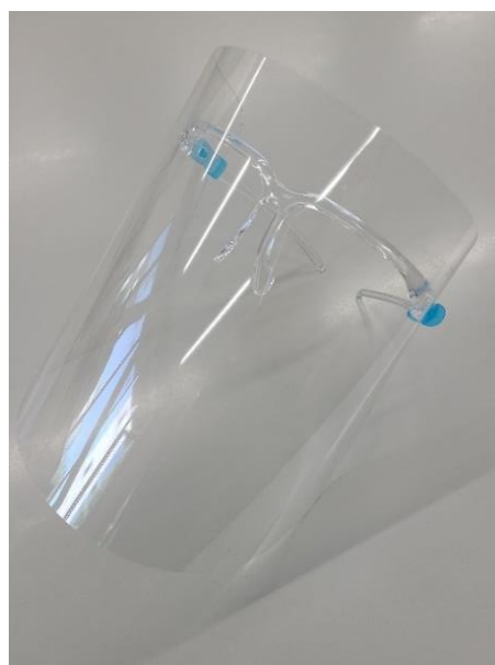
<7：めがね型フェイスシールド>